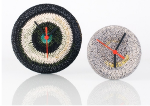
Kręgi na wodzie 2014