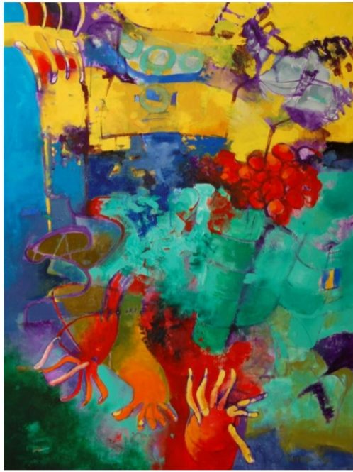
Vladimír Petřík, Sterowiec , akryl, 2009