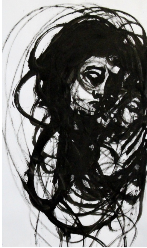
Książka - most między obrazem a słowem