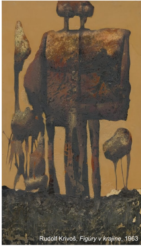
Rudolf Krivoš, Figury w krajinie , 1963